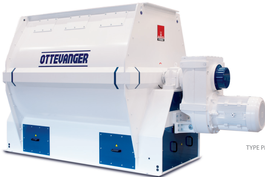
TYPE PM 8.000