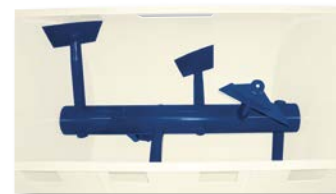
Axe mélangeur à palettes