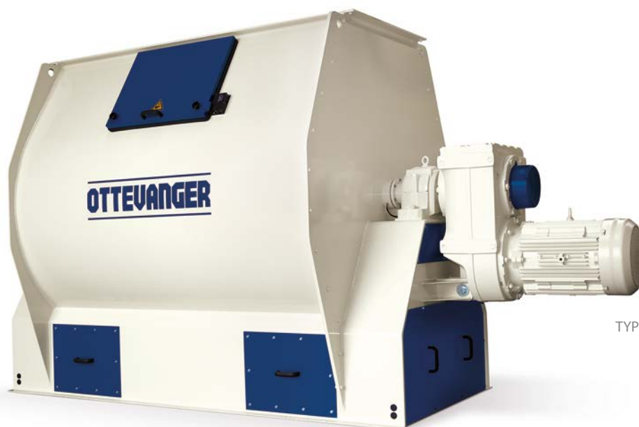
TYPE PM 6000