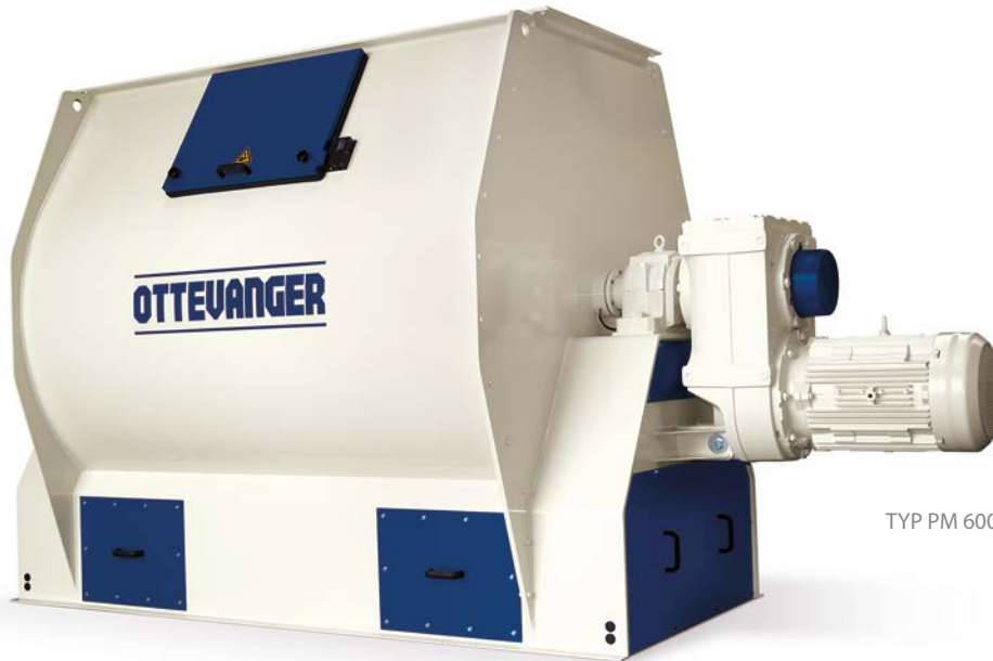
TYP PM 6000