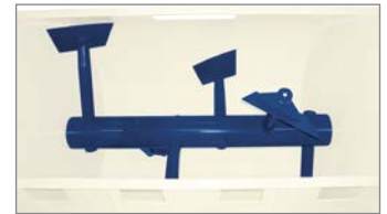
Mischwelle mit Paddeln